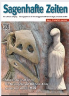
Titelbild: Collage: Humanoides Reptilienwesen aus der Tang Dynastie (Shaanxi History Museum Xi'an). Dinosaurierskelett (Landesmuseum Hannover).

Die Forschungsgesellschaft für Archäologie, Astronautik und SETI GmbH ist eine Gesellschaft nach Schweizer Recht. Zweck der Gesellschaft ist es, einen anerkannten Beweis für historische/prähistorische Besuche Außerirdischer auf unserer Erde zu erbringen. Dabei sollen die Grundregeln wissenschaftlichen Erkenntnisgewinns beachtet werden, ohne sich von bestehenden Dogmen oder Paradigmen eingrenzen zu lassen.